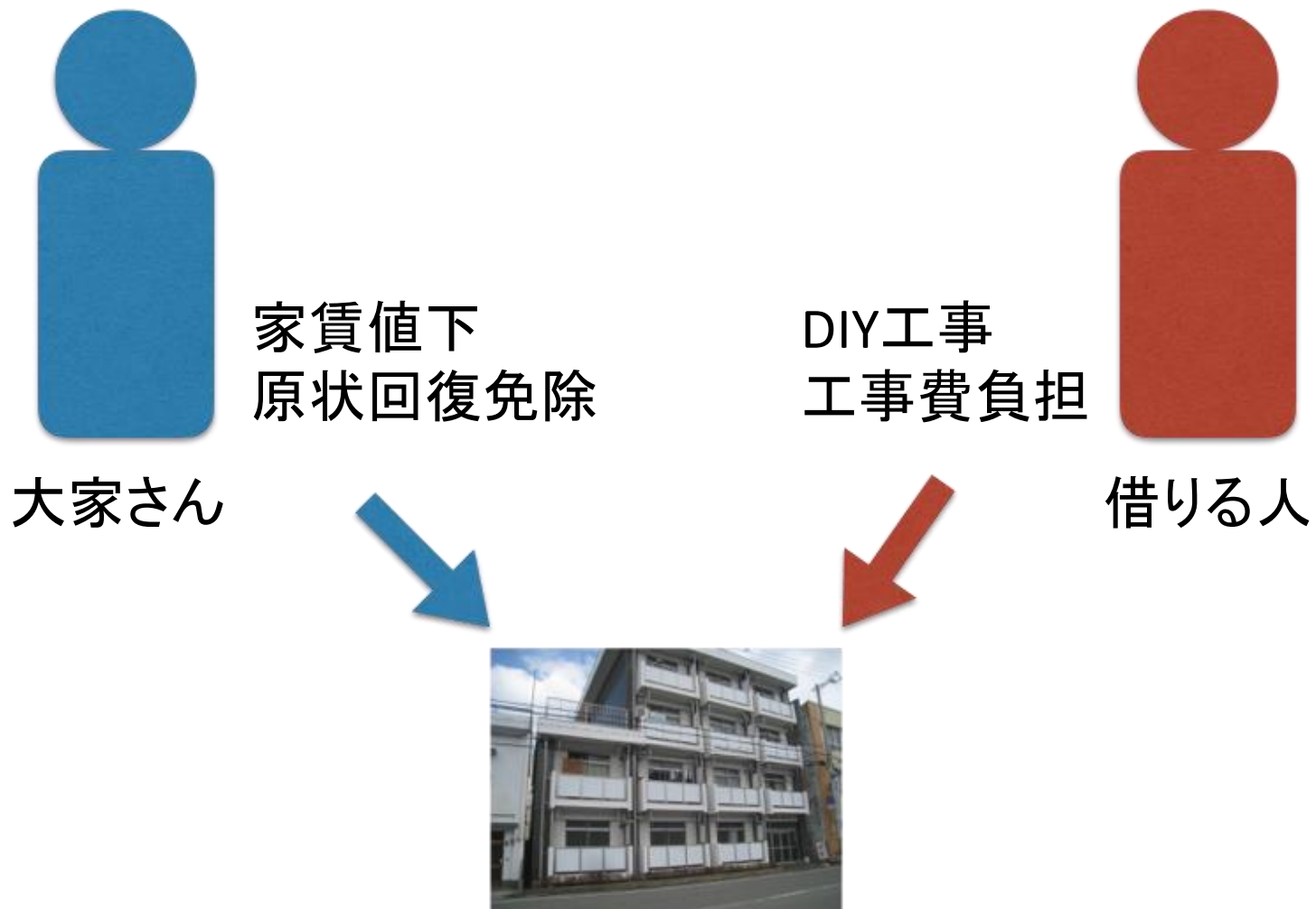
図：DIY賃貸借の仕組み